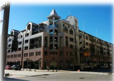
メルヘンの世界のお城のようにも見えます

プロムナード沿いに位置し、駅からも近いので、とても住みやすい建物と一体となっている自走式駐車場もとても便利