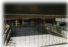
人気の高い自走式駐車場