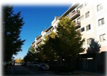
淡いピンクのタイルと木々が調和