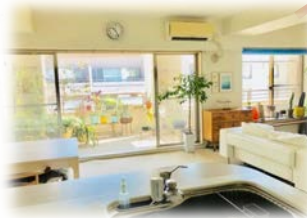
リビングダイニングがワイドスパン(幅8m)開放的な空間