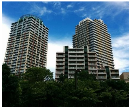
幕張ベイトウンを象徴するCENTRAL PARK

幕張ベイトウンを象徴する「セントラルパークエリア」 キッチン・ハウスやアトリエ・ハウスといったミニハウス、起伏のある中庭やケヤキ並木のある風景がまるで小さな街のよう海浜幕張駅からも近く、バルコニーからは海や富士山の眺望が楽しめるのがA棟夏の花火や公園の木々を通じて、季節の移り替わりを感じながら暮らせるのもその魅力