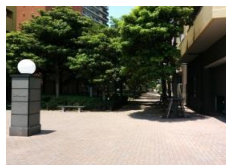
新緑のケヤキ並木道