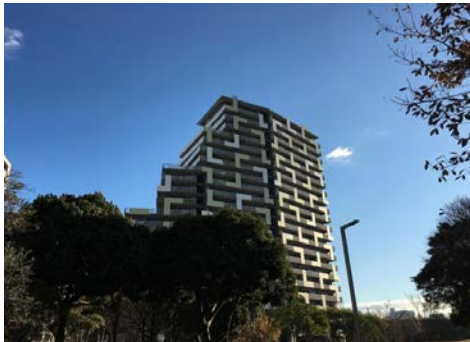
「隈研吾都市建築設計事務所」が手掛けた パティオスアバンセL棟

青空と公園に囲まれたパティオスアバンセL棟 空の青や木々の緑と調和する色あせないデザイン ベイタウンの街並みをとおしてみる眺望がとてもよいお部屋