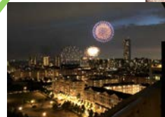
春には桜、夏には花火が楽しめます