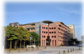
静かな住環境のパティオス12番街