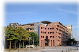
静かな住環境のパティオス12番街