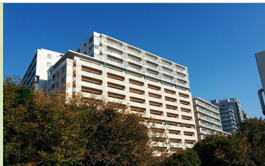
South Court B

花見川と東京湾の両方を眺めることができる 解放感たっぷりのお部屋 広いポーチからは ベイタウンの夜景と花火が楽しめます