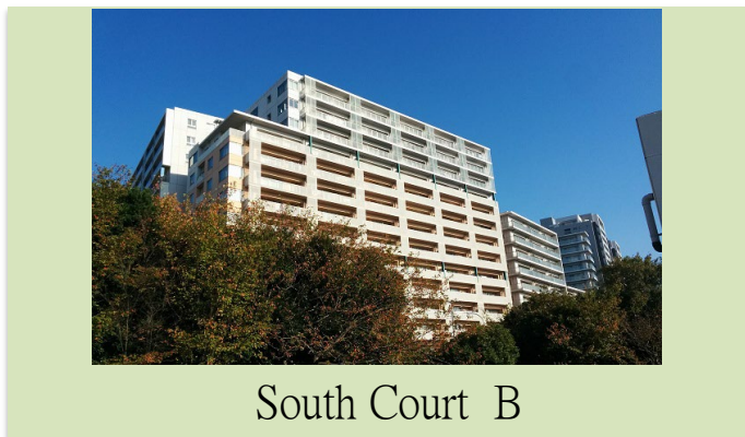
South Court B

花見川と東京湾の両方を眺めることができる解放感たっぷりのお部屋 広いポーチからはベイタウンの夜景と花火が楽しめます